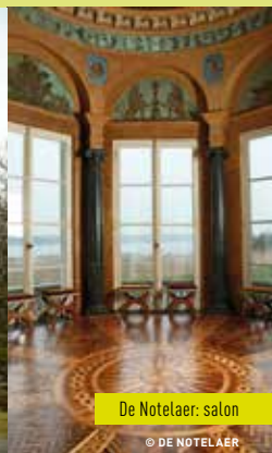
De Notelaer: salon