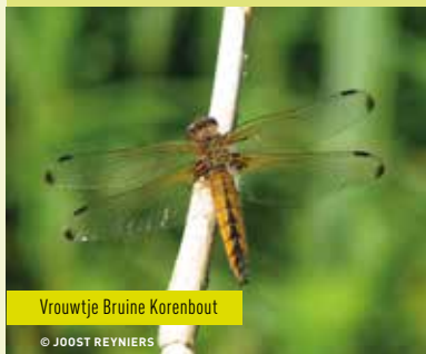
Vrouwtje Bruine Korenbout

Al onze libellen zijn bij wet beschermd . Als ze geen plaats vinden om te leven, dan is hun voortbestaan in gevaar. De Scheldevallei met haar wielen en polders vormt één van de belangrijkste libellengebieden van Vlaanderen . Je vindt er niet minder dan 31 soorten waaronder de platbuik, vuurjuffer, plasrombaut en breedscheenjuffer. Ook zuiderse soorten , zoals de zwervende pantserjuffer en de zuidelijke glazenmaker, vinden meer en meer hun weg naar onze contrèien.