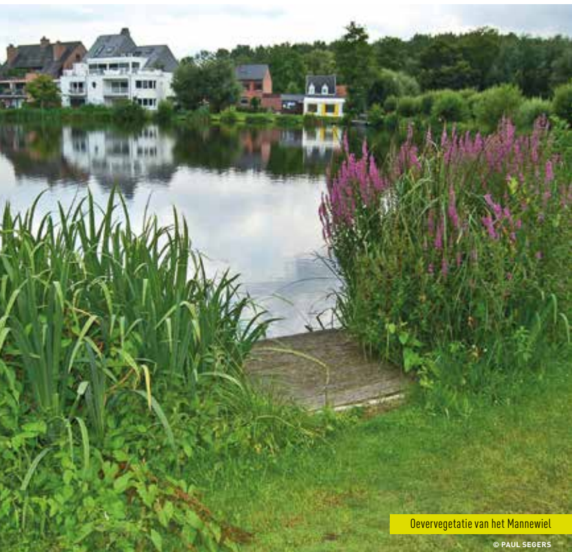
Oevervegetatie van het Mannewiel