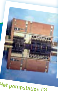
Het pompstation (2)