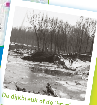
De dijkbreuk of de 'bres'